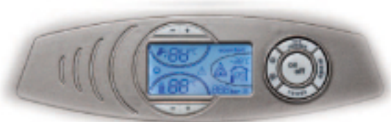
Tableau d'instruments pour gamme ATLAS D